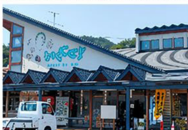
道の駅ふなこし （山田湾を望む絶景休憩スポット）