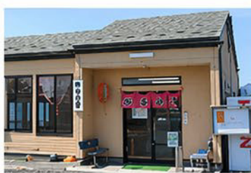
かき小屋 （三陸の旬を味わう）