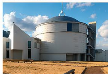
鯨と海の科学館 （巨大骨格展示で話題）